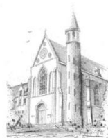
Parochie O.L.V. Onbevleekt Ontvangen Zenderen

Alvast heel hartelijk dank! Het parochiebestuur